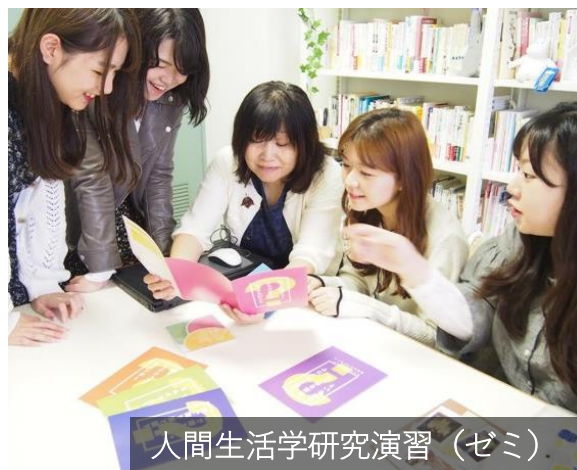
人間生活学研究演習 (ゼミ)