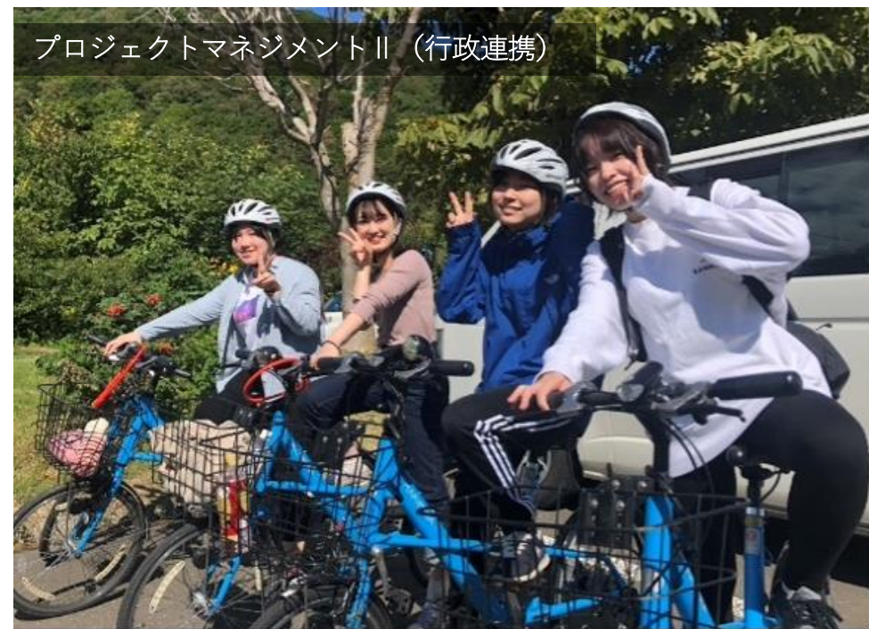
プロジェクトマネジメントII (行政連携)