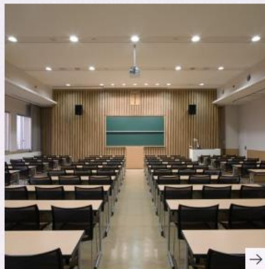
入学者選抜における変更点