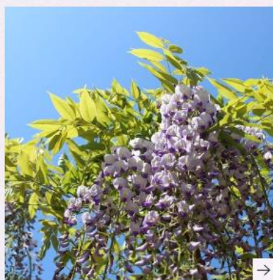
出願状況・入試結果