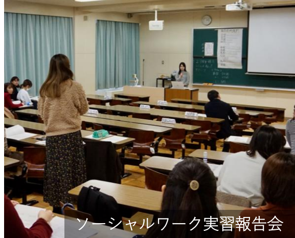
ソーシャルワーク実習報告会